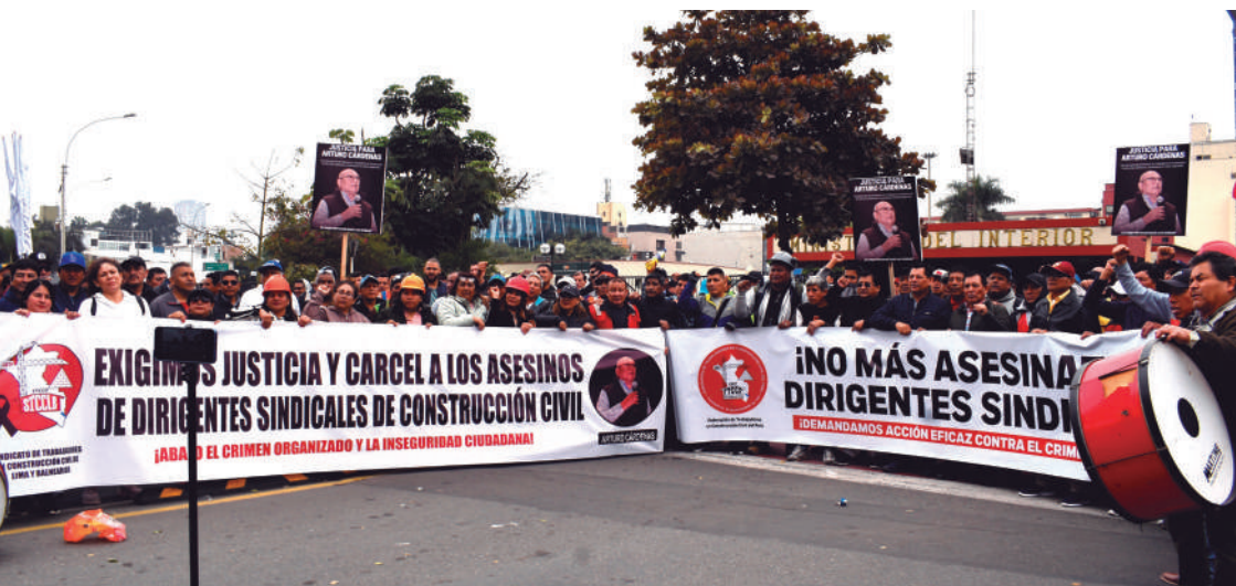
05 de setiembre de 2024. Plantón en el MININTER exigiendo justicia ante asesinatos.