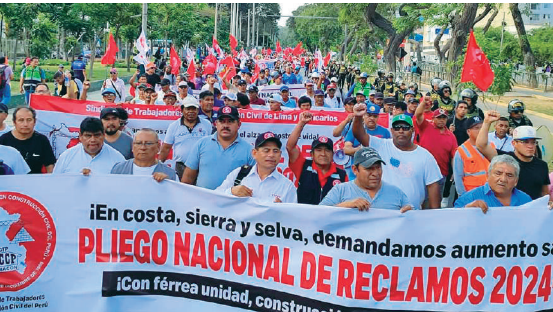
04 de abril de 2024. Lima: Presentación del Pliego Nacional de Reclamos 2024-2025 de Construcción Civil .