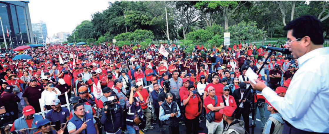
24 de octubre de 2024. Lima: Movilización Centralizada contra la Delincuencia y por la Paz.