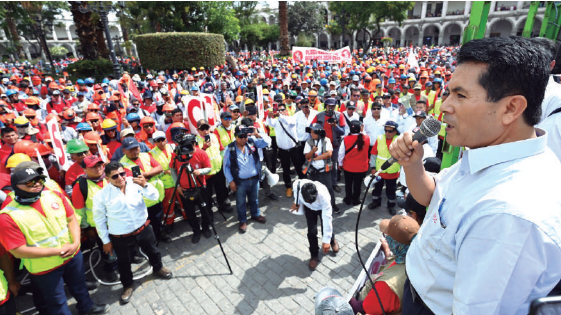
04 de abril de 2024. Plaza de Arequipa: Presentación del Pliego Nacional de Reclamos 2024-.2025.