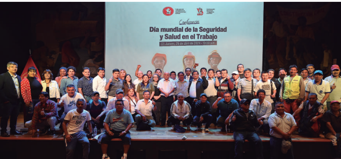
25 de abril de 2024. Conferencia por el Día Mundial de la Seguridad y Salud en el Trabajo (28 de abril).