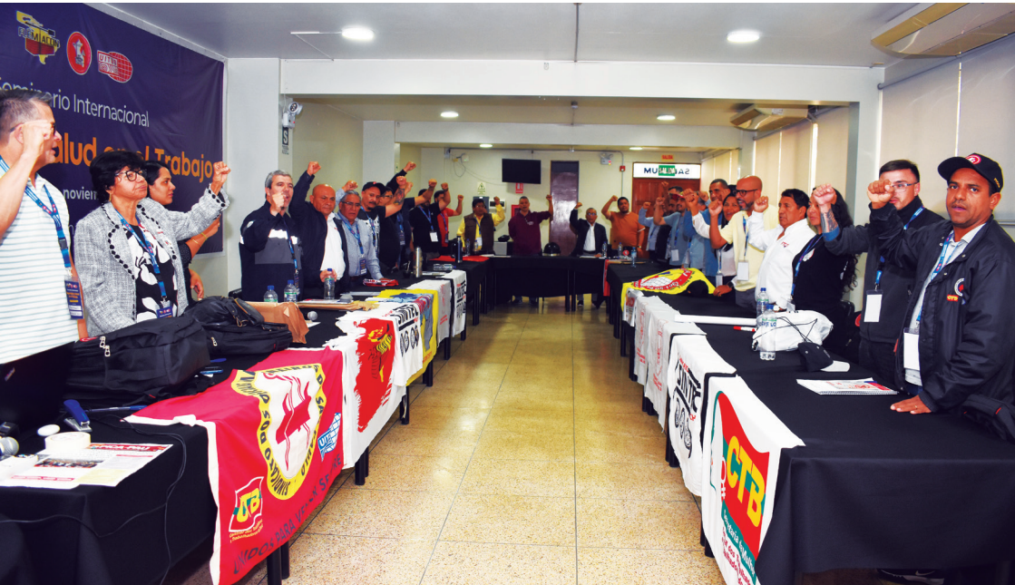
06-07 de noviembre de 2024. Lima: Seminario Internacional de Seguridad y Salud en el Trabajo de la FLEMACON.