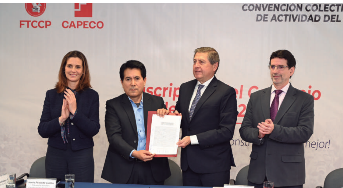
27 de agosto de 2024. Suscripción del Convenio Colectivo 2024-2025 del Sector Construcción.